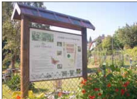
BE - Kinderkräutergarten am Apfelweg in Rengsdorf

Beim KRÄUTERWIND-Gartentag "Schau mich an" können Sie in die Blüten- und Kräuterpracht in mehr als 40 Gärten im Westerwald eintauchen. Aus der Broschüre "Kräuterwind Erlebnisjahr 2013" (im Rathaus erhältlich) und aus der Internetseite www.kraeuterwind.de sind die einzelnen Termine ersichtlich.