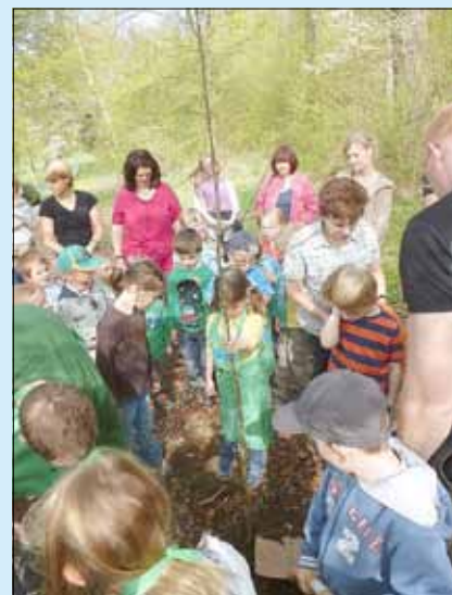
Begeistert halfen die Kinder den Baum zu pflanzen.

TREFFPUNKT: DORFGEMEINSCHAFTSHAUS NIEDERRADEN