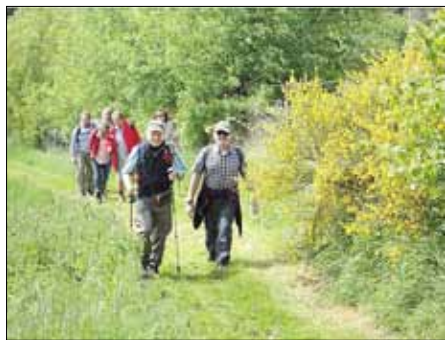
Am „Kniebrecherpfad“ bei Leutesdorf

Wir möchten Sie einladen, mit uns an unserem Volkswandertag die herrliche Umgebung von Rengsdorf zu erwandern. Wir haben für Sie eine wunderschöne Strecke ausgewiesen, auf der Sie auf den Höhen des Westerwaldes die landschaftliche Schönheit des Rengsdorfer Landes kennen lernen.