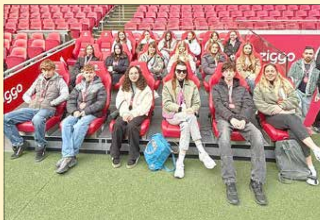
Foto-Unterzeile: Beim Besuch des Fußballstadions in Amsterdam erhielten die Jugendlichen spannende Einblicke hinter die Kulissen des Profifußballs der Johan-Cruyff-Arena

Sportlich wurde es bei der Besichtigung des Fußballstadions in Amsterdam. Dort erhielten die Jugendlichen spannende Einblicke hinter die Kulissen des Profifußballs der Johan-Cruyff-Arena und konnten die besondere Atmosphäre des Stadions hautnah erleben.