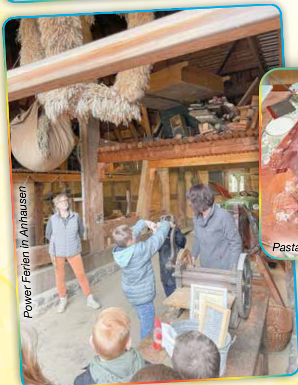
Power Ferien in Anhausen