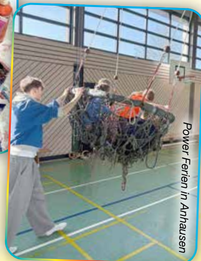
Power Ferien in Anhausen