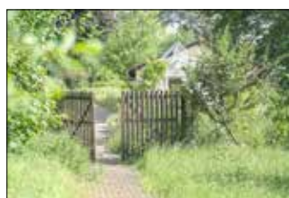
Das Gartentor zu den Klostergärten der Waldbreitbacher Franziskanerinnen