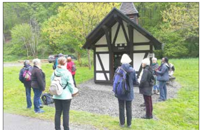
Die Gedenkstätte im Fockenbachtal ist eine Station der Pilgerwanderung. An dieser Stelle stand im 19. Jahrhundert eine Ölmühle, die Mutter Rosas Vater gepachtet hatte. Hier lebte die Ordensgründerin als junges Mädchen mit ihrer Familie.