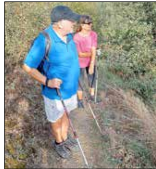
Besonders die 12 km Strecke ist für Nordic-Walker*innen interessant.

Der diesjährige Volkswandertag des TV Rengsdorf findet an Christi Himmelfahrt, am 9. Mai 2024, mit Start am Freibad in Rengsdorf statt. Der TV Rengsdorf ist immer bemüht, bestehende Konzepte, und seien sie noch so bewährt, zu überdenken und sich für neue Ideen zu öffnen. Und das ist gut so: Wenn er sich nicht verändert hätte, wäre der Volkswandertag nicht über 50 Jahre erfolgreich gewesen. Nachdem in den letzten Jahren digitale Unterstützung auf den Wander- und Laufstrecken entwickelt und ein neues Müllkonzept umgesetzt wurde, soll es in diesem Jahr etwas sein, wovon zwei Zielgruppen besonders etwas haben: Kinder und Walker*innen.