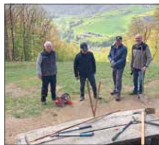
Einen tollen Blick auf das Wiedtal hat man auf dem Westerwaldsteig, am Gleitschirm-Startplatz in Roßbach-Rahms. Eine Gruppe der Roßbacher Rentner machte das Teilstück wieder begehbar.

Ein vielschichtiges Arbeitsprogramm hatte sich die Rentnergruppe Roßbach bei ihrem jüngsten Arbeitseinsatz vorgenommen. Aufgeteilt in mehrere Gruppen, reinigten zwei Gruppen die Verkehrs- und Straßenschilder im Ort.