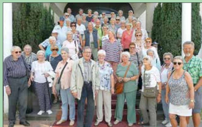
Archivbild: Tagesfahrt 2022