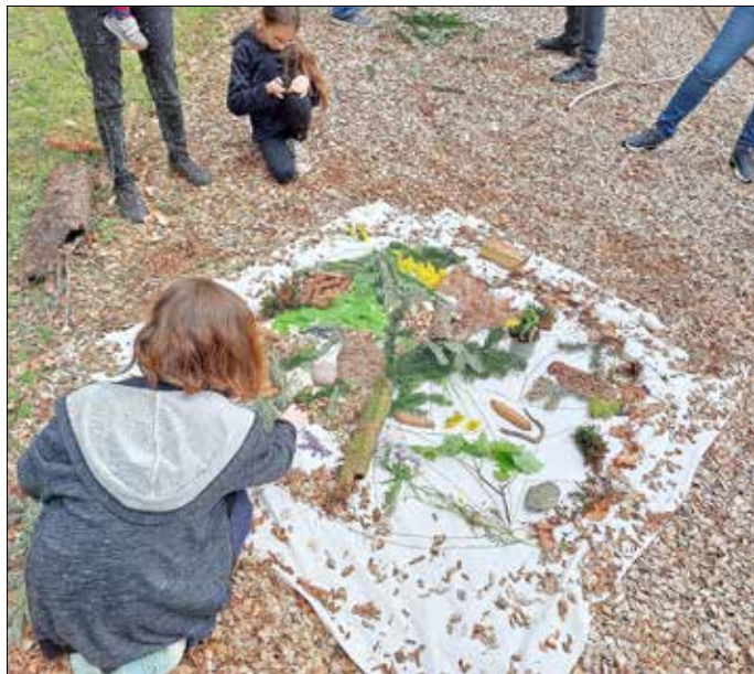
Bei unterschiedlichen Aktionen lässt sich der Wald als Kraftquelle entdecken.

Kolbenstein Kraft zu tanken. Unter der behutsamen Begleitung von ausgebildeten Trauerbegleiter/innen haben sie die Gelegenheit, Impulse für ihren eigenen Trauerweg zu erhalten und sich auszutauschen. Unter Anleitung von Förster Christoph Mayer besteht zudem die Möglichkeit, den Wald und dessen wohltuende Wirkung auf den Menschen wahrzunehmen und als Kraftquelle in Krisenzeiten zu entdecken.